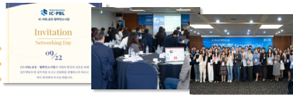
네트워킹 데이(Networking Day)

참여대학 실무진이 한자리에 모여 서로의 경험과 성과를 생생하게 나누고 협력의 새 가능성을 확장하는 네트워킹 행사