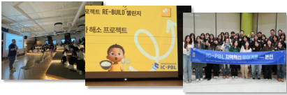
지역혁신 메이커톤 및 문제해결 챌린지

참여대학 학생들이 직접 지역기업 문제를 대상으로 문제 해결 과정을 수행하는 실천형 프로젝트 프로그램