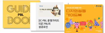
ToolKit 및 워크북 개발 연구

IC-PBL 수업 운영부터 지역문제 해결까지 교수자와 학생 모두가 현장에서 바로 활용할 수 있는 교육 콘텐츠를 개발